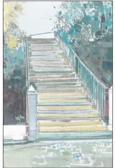
Motiv C ILLUSTRATION: MAUERSBERGER