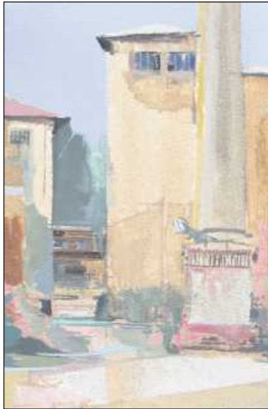
Motiv B ILLUSTRATION: MAUERSBERGER