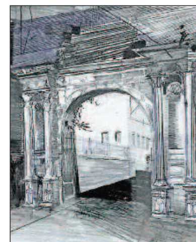
Unser dieswöchiger Preis: eine Mauersberger-Zeichnung von Bockenheim.

Die Mauersberger-Ausstellung kann bis September 2020 nach telefonischer Vereinbarung besichtigt werden: 0171/5775690.